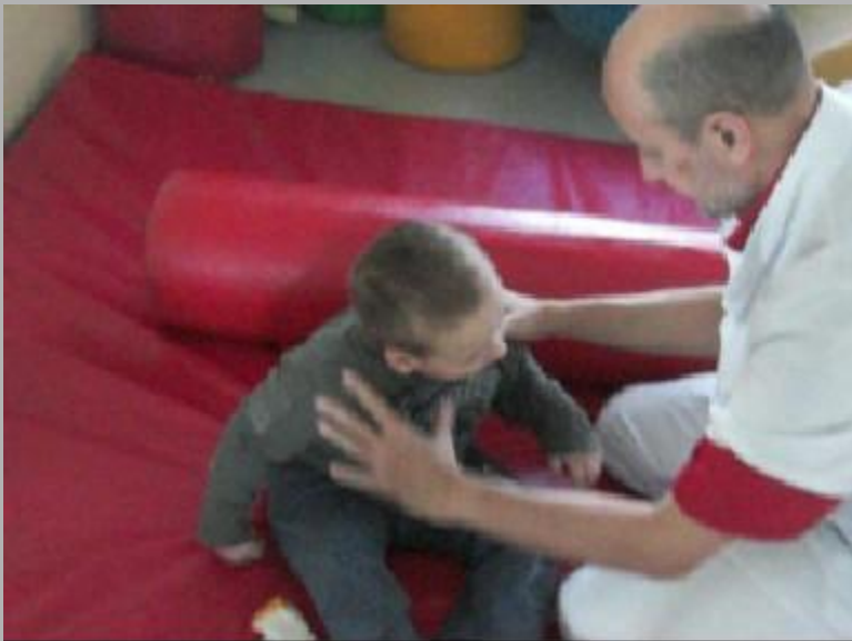
Photo B : correction de la position de la tête avec extension et adduction des membres inférieurs

Les membres inférieurs se placent « en batracien ».